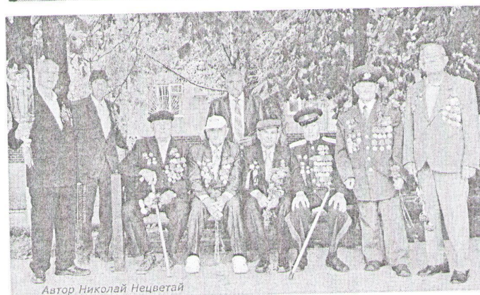
Автор Николай Нецветай