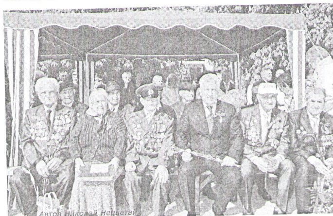
Автор Николай Нецветай