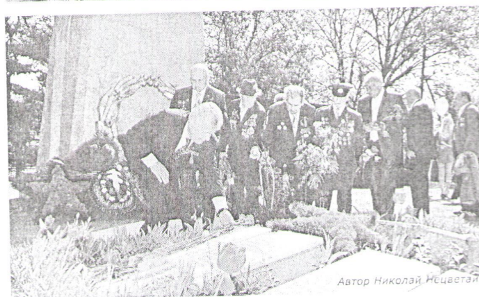
Автор Николай Нецветай